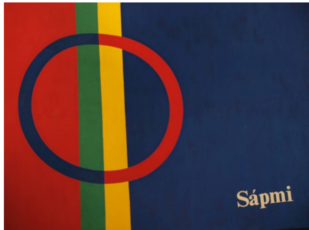
Foto im Samenmuseum in Jokkmokk aufgenommen http://www.ajtte.com/ (Photo taken in the museum/ Sami center in Jokkmokk)

In „Hektors Reise oder die Suche nach dem Glück“ von Francois Lelord wird als einer der Regeln für ein glückliches Leben genannt, man solle mindestens einmal im Jahr einen Ort aufsuchen, an dem man noch nie war: Francois Lelord names in the book „Hector’s voyage“ one rule to be happy: Once a year you should visit a place, where you have never been before: Eine Woche im Land der Samen, das sie selbst Sápmi nennen. One week in the country of the Sami-people, this is called Sápmi by themselves.