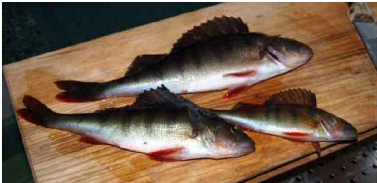
Fische aus dem See,