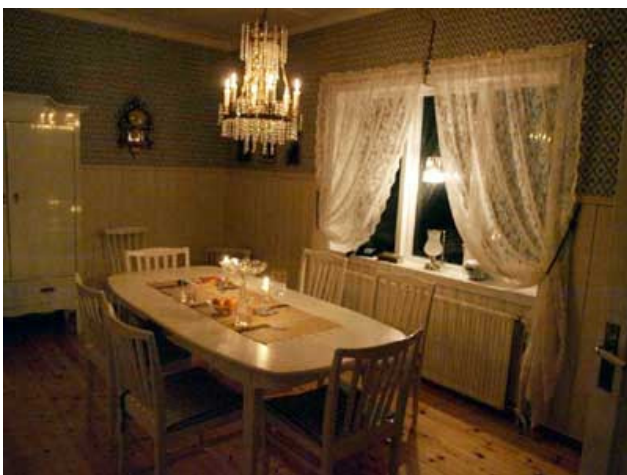
die sich für uns geopfert haben ... Some fishes have sacrificed themselves for us