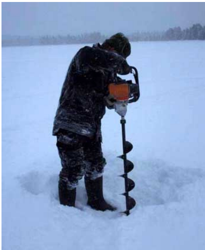
Stig, die gute Seele von Mittigården, bohrt Löcher in die Eisdecke eines Sees zum Eisangeln.